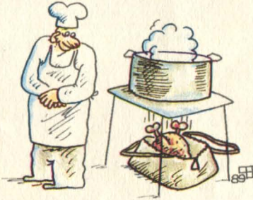
Рис. В. Федорова.